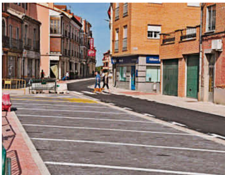
Zona de estacionamientos en batería en la calle del Carmen. J.H.

Antes de la obra esta calle era de doble sentido. Una vez que se abra al tráfico sólo admitirá un sentido de circulación en un carril, ya que se ha