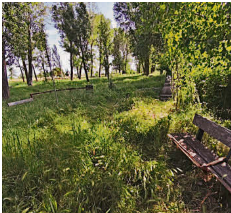
Banco roto y abundante vegetación en la zona de la fuente. J.H.

ya agostado la vegetación, se desbroce. Pero a finales de junio”, opina esta vecina, que se muestra a favor de dejar tranquila a la naturaleza en este espacio público.