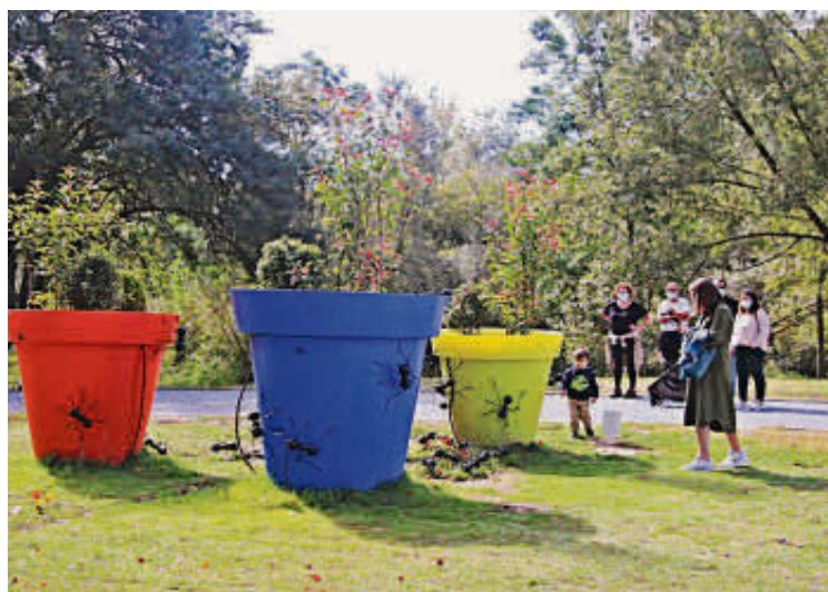
Una familia fotografiando la escultura de las hormigas o 'Matildas'.

que son los protagonistas de miles de fotografías durante el último año, como son los elementos de la "Ruta de los Lápices" y las tres esculturas del proyecto "Arte Emboscado" con la garza 'Adelita', el pájaro carpintero 'Wenceslao' y las 'Matildas', que son las hormigas ubicadas junto al Centro de Interpretación. Junto a ellos el protagonismo natural se los llevan los 1.750 árboles que se han plantado para completar la reforestación de la Isla del Soto. Entre las peticiones de los vecinos de Santa Marta para seguir atrayendo visitantes y que siga creciendo el tirón de la Isla hay una muy peculiar y es que se habilite alguna zona de baño, algo de lo que ahora carece.