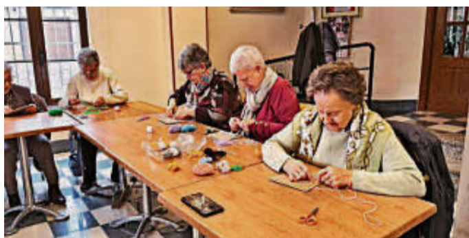
Taller de manualidades para los mayores de Carbajosa.