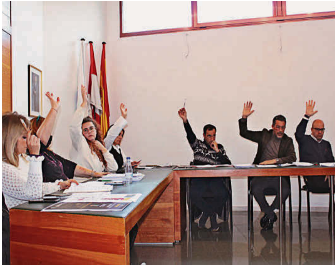
La votación del presupuesto para 2023 en la localidad de Villamayor de Armuña.