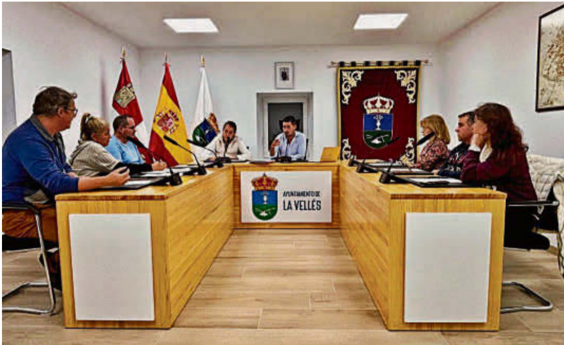
La Vellés estrenó su nuevo salón de plenos con la aprobación de la nueva normativa urbanística. EÑE

● Estará ubicado en la carretera de Fuentesauco en la margen derecha junto al frontón