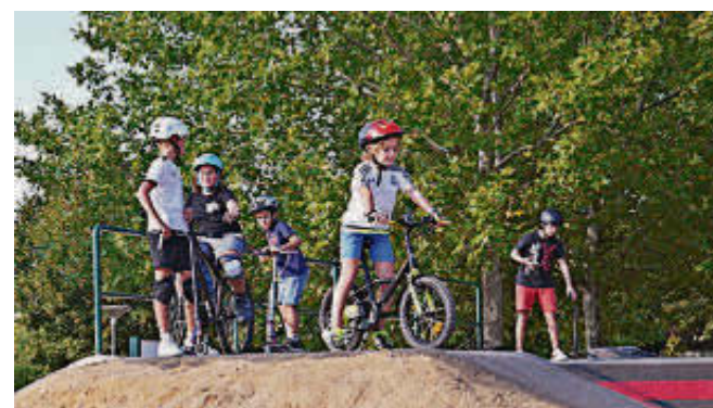
Participantes de la "Kdada BMX" de la Semana de la Movilidad.

La concejala de Fomento, Marta Labrador, ha explicado que "con el verano, la escasez de lluvias y la gran afluencia de visitantes que ha tenido Santa Marta vimos la necesidad de acometer un plan de limpieza específico para dejar las vías más afectadas en las mejores condiciones posibles".