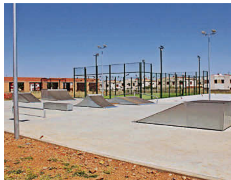
Doñinos ha incorporado una pista de skate a sus zonas deportivas.

El municipio ha realizado a lo largo de esta legislatura otras inversiones y mejoras en los espacios deportivos al aire libre que se han destinado a la piscina pública y también al campo de fútbol.