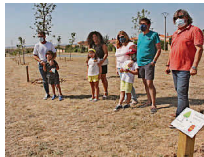
Representantes municipales y padres, en el Bosque de los Niños.

Con esta reforma, el Consistorio destaca la importancia de llevar a cabo este tipo de actuaciones para mejorar el mobiliario urbano y, al mismo tiempo, poder ofrecer una buena imagen para los niños, sus principales usuarios, y sus familias para que sientan una mayor seguridad cuando acudan a estos recintos de juegos.