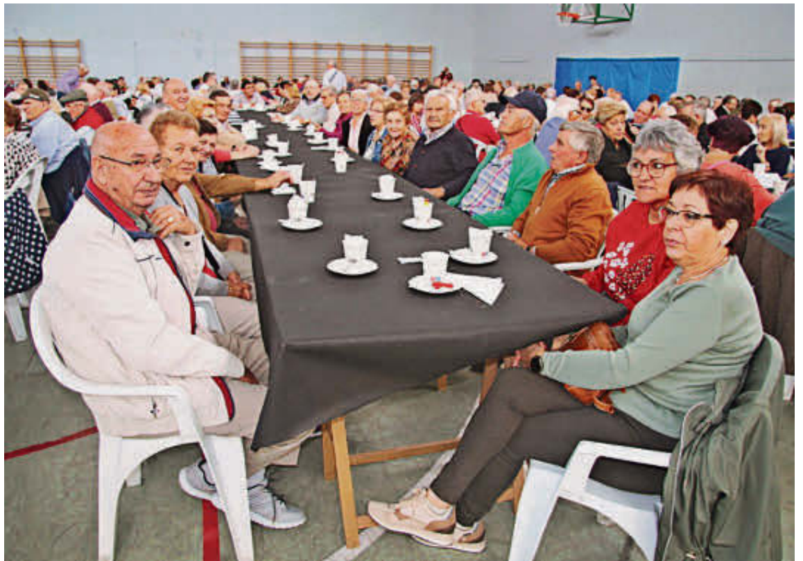
Los mayores de la localidad en una de las mesas durante el desayuno de bienvenida.

En la edición de este año estuvieron representados una veintena de municipios, tanto del alfoz como de distintas comarcas como fueron La Armuña, Las Villas, la Sierra de Francia y también la zona de Vitigudino.