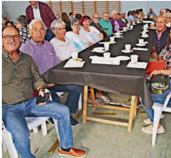
El grupo de veteranos de Aldeatejada.