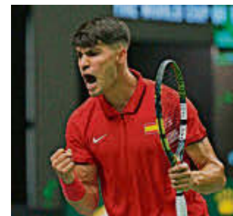
Carlos Alcaraz.

La España de Alcaraz no sucumbre ante la República Checa