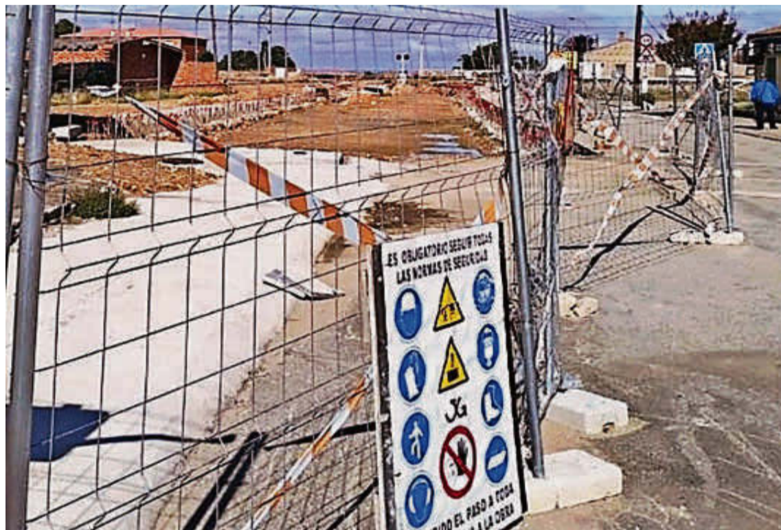
Las obras de supresión del paso a nivel a la entrada del casco urbano de Gomecello. | EÑE

Según la empresa "se han iniciado también los trabajos de descabezado de pilotes y próximamente se iniciará la excavación de los accesos al futuro paso inferior y al foso donde se ejecutará el cajón de hormigón". El parón actual que afecta a la ejecución de las obras de supresión del segundo paso a nivel en la localidad de Gomecello también ha llegado al Congreso, de la mano de una pregunta al Gobierno por parte de los parlamentarios del PP José Antonio Bermúdez de Castro y María Jesús Moro.