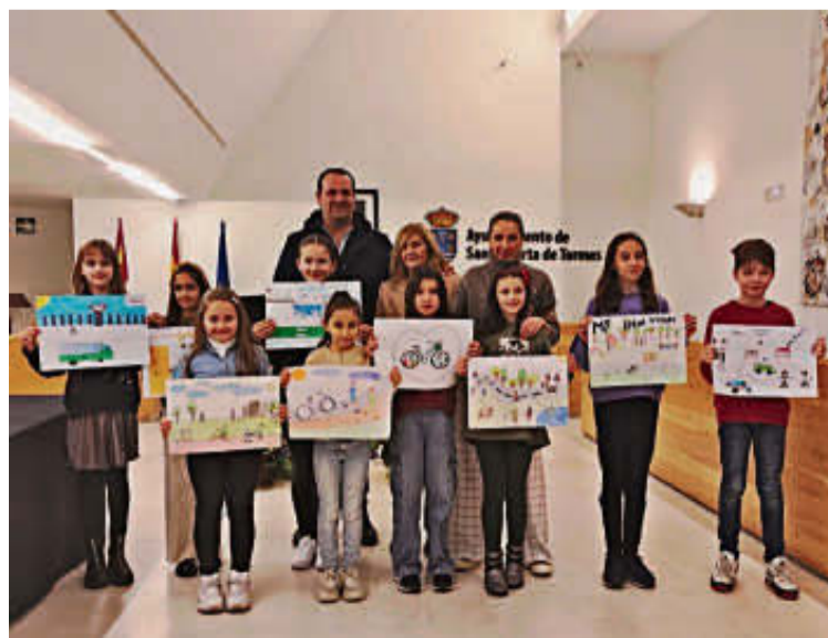
Los escolares premiados, junto al alcalde y las dos concejalas. EÑE

En esta nueva edición del certamen en la que participaban los alumnos de los centros educativos,