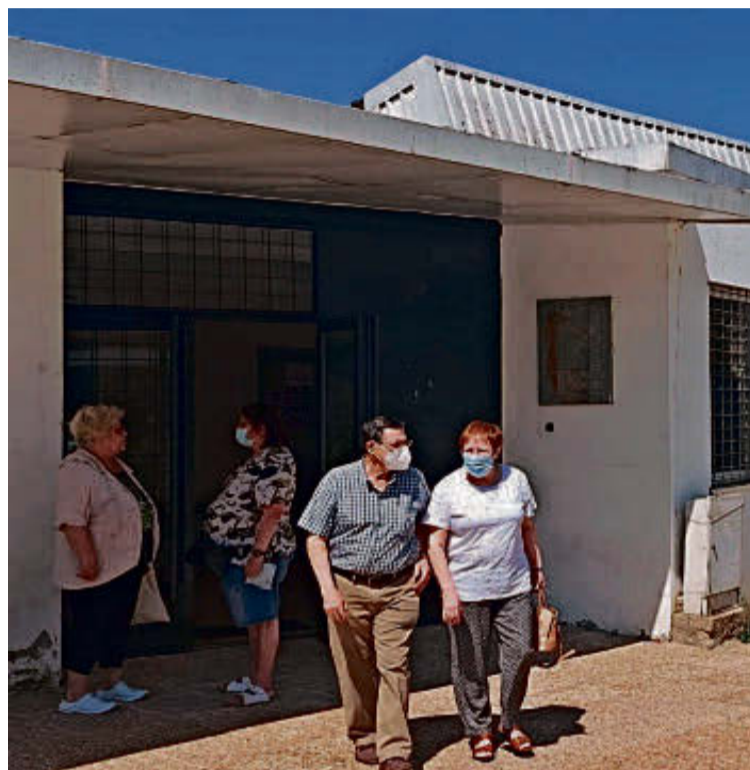
Varios usuarios en la puerta del consultorio médico de El Encinar.

La última revisión que se había efectuado en la instalación antes de que se produjese el derrumbe del 22 de diciembre se había efectuado en 2020 y tal como reflejaba el informe de esta actuación y relató el alcalde, Alejandro Álvarez “no había grietas ni nada que indicase problemas”. Además, cabe recordar que en verano de 2020 también se reparó el tejado y la sobrecubierta del consultorio médico de El Encinar con un obra de cerca de 10.000 euros que afrontó el Ayuntamiento.