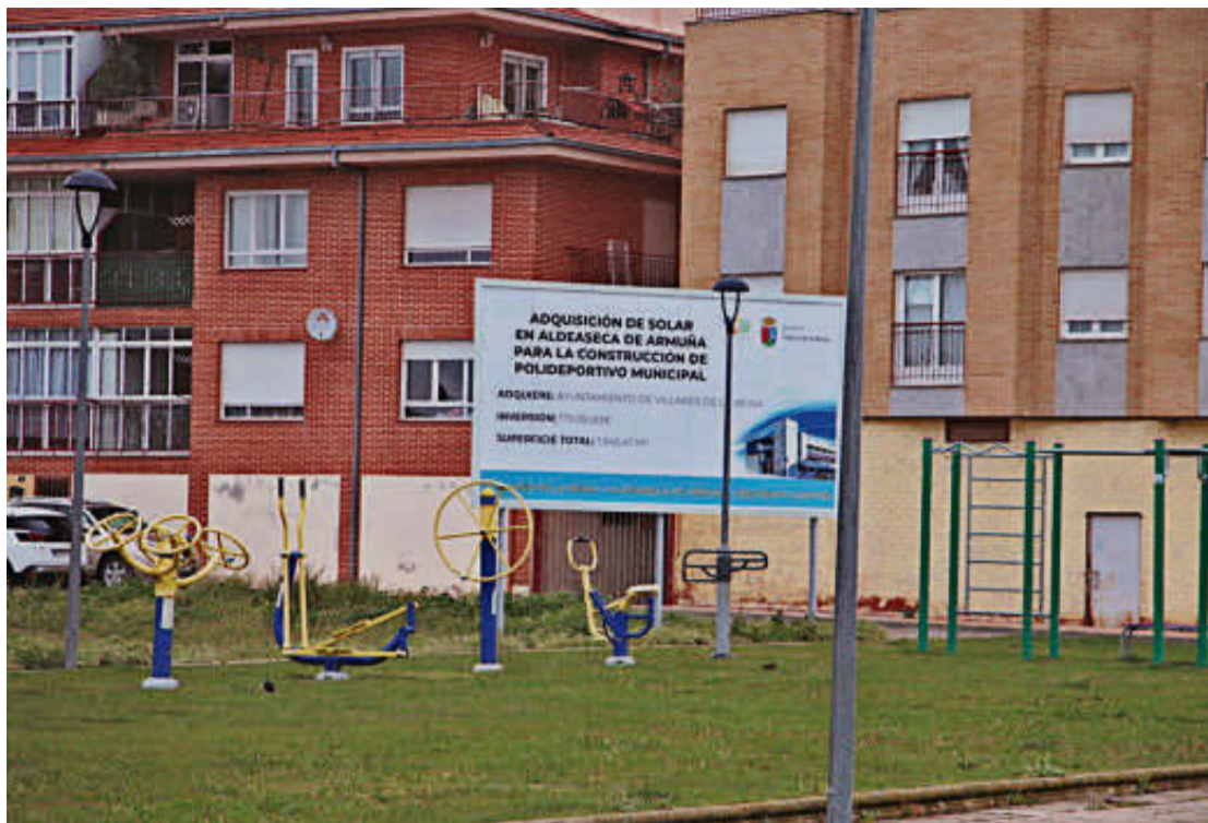
La parcela de Aldeaseca de Armuña en la que se va a construir el pabellón fue comprada por el Ayuntamiento. EÑE