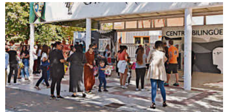
La salida del colegio Pablo Picasso en Carbajosa de la Sagrada. EÑE

El proyecto de la pista polideportiva, cubierta y ventilada, supondrá para la pedanía contar también con un nuevo espacio con despachos y sala de espera al que se trasladará en el futuro los servicios sanitarios del consultorio médico. Esta parte se ha previsto que ocupe casi cien metros cuadrados y permitirá a los vecinos contar con un recinto propio y dotado con mayores medidas de privacidad para los usuarios de los servicios sanitarios o las consultas. De manera paralela cuando comience el uso de estas nuevas consultas se logrará liberar los espacios que actualmente están reservados en la Casa Consistorial.