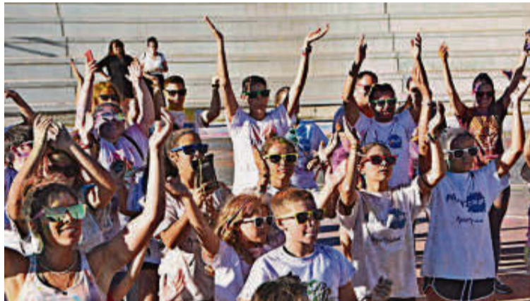
Niños y jóvenes participaron activamente con bailes y coreografías.

Pasadas las seis y media de la tarde y siguiendo las indicaciones de los organizadores, abrieron a la vez las bolsas y lanzaron de forma