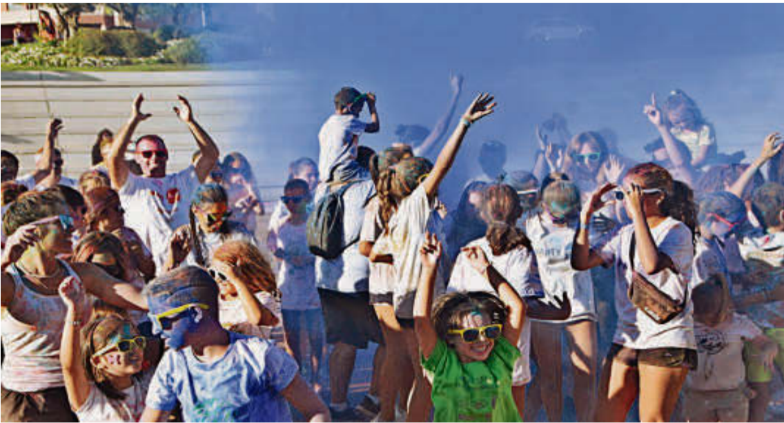
Momento en el que los animadores inundaron de color a todos los participantes de la Color Party.