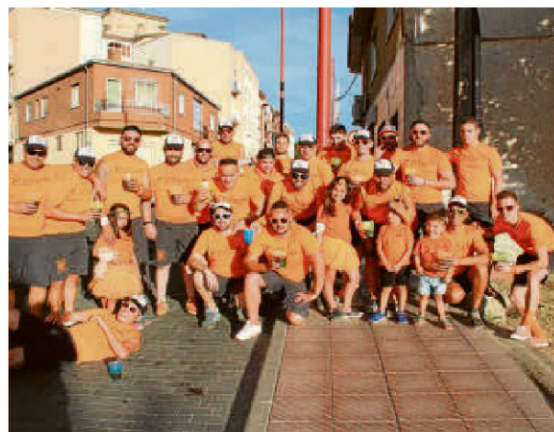
La Peña Abirras, un clásico que no puede faltar en las fiestas.

El balcón del Ayuntamiento fue el escenario desde el que en