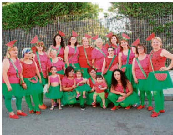
Las Águedas, fieles a su cita, lucieron un llamativo traje de sandias.

Al ritmo de la música y bajo el control de seguridad de la Policía Local, Guardia Civil y Protección Civil, la gran serpiente de color recorrió a su ritmo las calles, luciendo sus llamativos y atrevidos atuendos con los que seguirán destacando su presencia en los distintos actos programados hasta el domingo, aunque algunos ya le dieron un buen es-