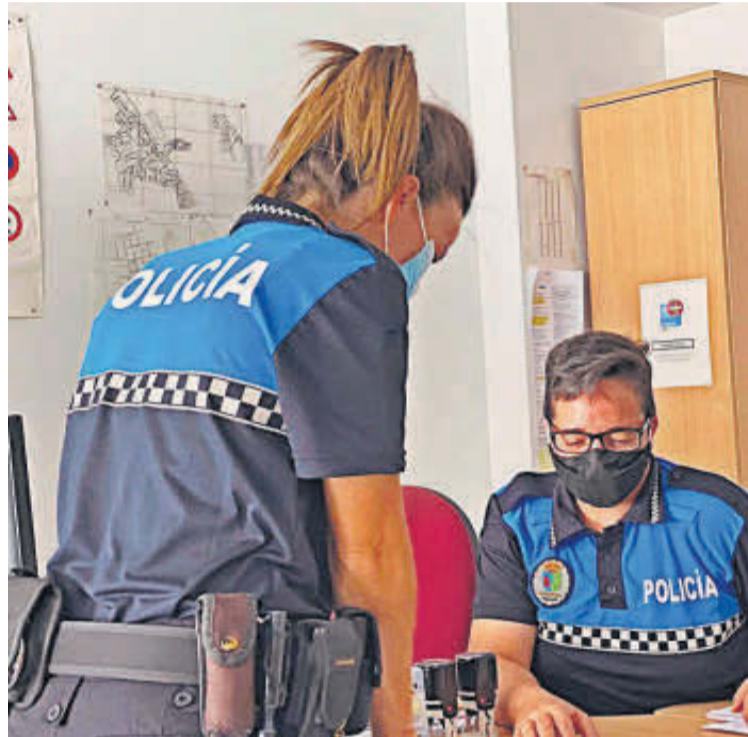
Las dos agentes que prestan actualmente sus servicios en Villamayor. | EÑE

Además, los responsables municipales dan un paso más en la ampliación del cuerpo de Policía Local y han solicitado la adhesión al convenio de la Consejería de Fomento de la Junta y la (FEMP) para delegar la coordinación y gestión de los procesos de selección de las nuevas plazas, dado que desde el Consistorio "no tenemos capacidad para organizar el tribunal ni recursos técnicos suficientes".