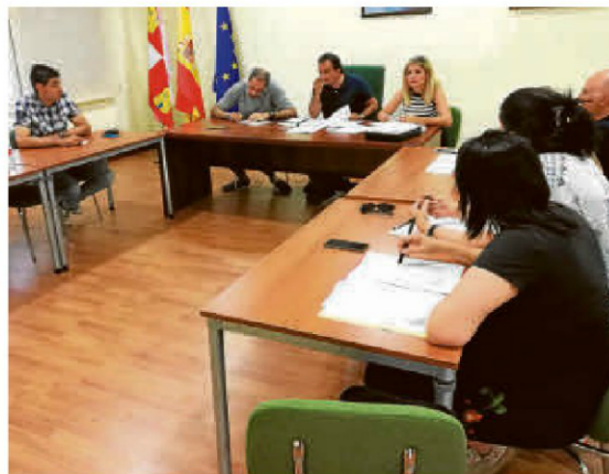
La Corporación municipal durante el pleno ordinario de ayer. I.EÑE

Asimismo, el pleno dio luz verde al trámite legal de adhesión del municipio a la comunidad de usuarios del azud de Villagonzalo.