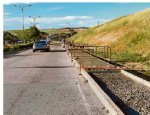
Obras del nuevo acerado al inicio de la calle Diego Velázquez. | ENE

de más edad, trepadores y toboganes, y a los que se han unido una gran variedad de juegos pintados en el suelo. Además de la instalación anexa de un parque 'workout' o de calistenia, para que jóvenes y adultos puedan disfrutar de hacer deporte al aire libre, "lo que convierte a esta zona en un lugar de uso para todos los públicos".