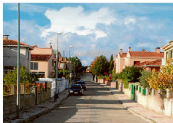
El Consistorio renovará todo el alumbrado exterior del municipio.