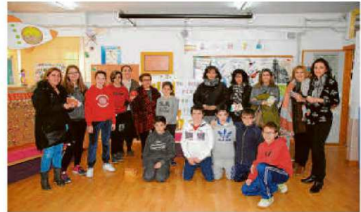
Escolares, padres y profesores durante la celebración del mercadillo.

Se trata, según explican los responsables del centro, de un proyecto interdisciplinar puesto en marcha con el objetivo de estimular la creatividad de los escolares, así como sus iniciativas a la vez que se fomenta el trabajo en equipo y se dan a conocer algunos conceptos e ideas de la cultura emprendedora.