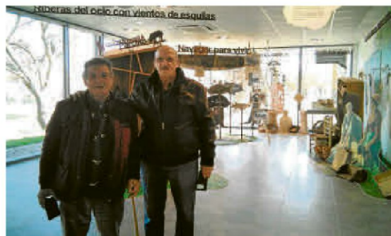
Visitantes en el Centro de Interpretación de la Isla del Soto.

Cabe recordar que este centro de interpretación consta de tres espacios: uno expositivo, en la que se podrán ver figuraciones sobre los oficios tradicionales de las riberas y que invitará a realizar reflexiones sobre los usos en el futuro y donde se ubicará la muestra 'De los oficios del ayer a los usos del hoy'; un segundo es-