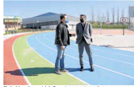
El alcalde y el concejal de Deportes presentaron el programa. WORD

El Ayuntamiento de Alba de Tormes ha informado que en las dos últimas semanas se han realizado diferentes trabajos de arreglos y mejoras, destacando el acondicionamiento en el cementerio municipal, diversos arreglos en el CEIP Santa Teresa o de desperfectos en el interior de la plaza de toros. Además se ha procedido a realizar diversas mejoras en el pavimento, como el arreglo de baches en la Plaza Mayor o el acceso a la villa ducal a su entrada por la carretera de Salamanca, en la calle Boulevard o plaza del Grano. También se ha instalado un resalto en la calle San Francisco y se ha pintado un paso de cebra en la calle de la Sal.