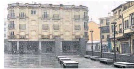
Ayuntamiento de Guijuelo. WORD