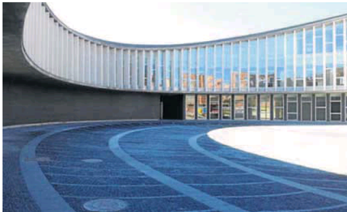
Ayuntamiento de Santa Marta de Tormes. WORD