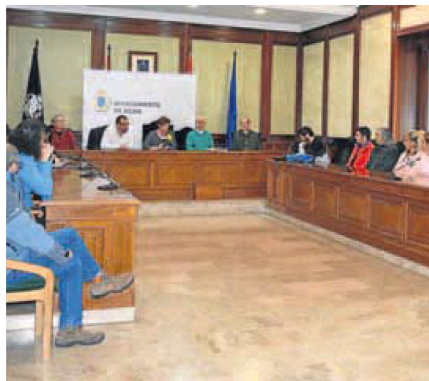
Reunión con los doce participantes en los talleres. :: WORD

Las seis personas que se encuentran en albañilería cursarán dos Certificados de Profesionalidad completos y realizarán los trabajos necesarios para el aprendizaje de los participantes, con un total de 1.325 horas teórico-prácticas. El proyecto que realizarán será la rehabili-