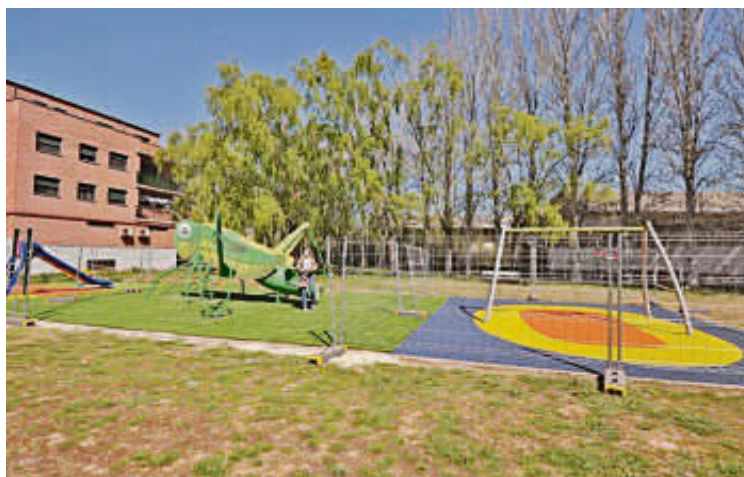
El parque de la calle Segovia cuenta con nuevos juegos.