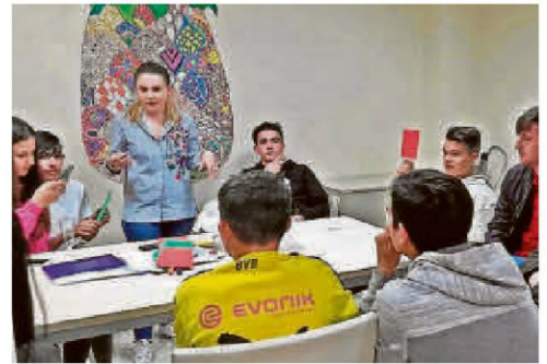
Los jóvenes de Santa Marta durante una de las actividades.