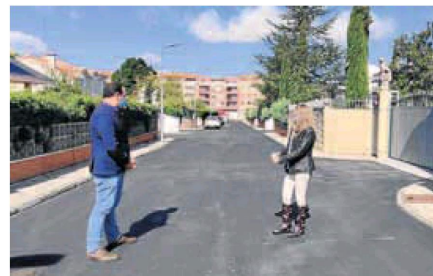
El alcalde comprueba el resultado final de las obras.