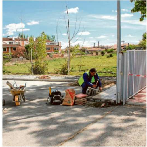
Los trabajadores realizan obras de mejora en el municipio. | ENE

De esta manera, los 10.000 euros recibidos se destinarán a contratar dos discapacitados, que comenzarán a trabajar el próximo día 15, y realizarán labores de auxiliar administrativo y ordenanza, que contribuirán a reforzar las áreas municipales de Empleo y Formación y de Servicios, respectivamente, para