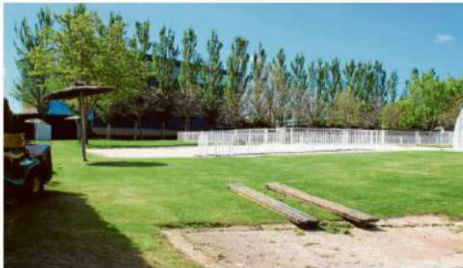
Las piscinas municipales abrirán sus puertas el próximo sábado. | ENE