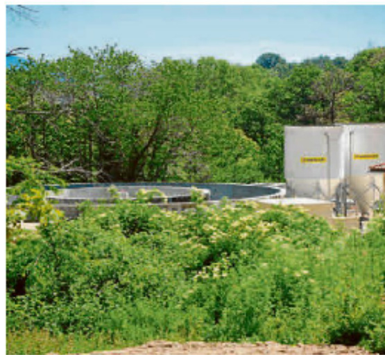
Una de las depuradoras del Parque Natural de Las Batuecas.

El Plan de Ordenación de los Recursos Naturales de Las Ba-