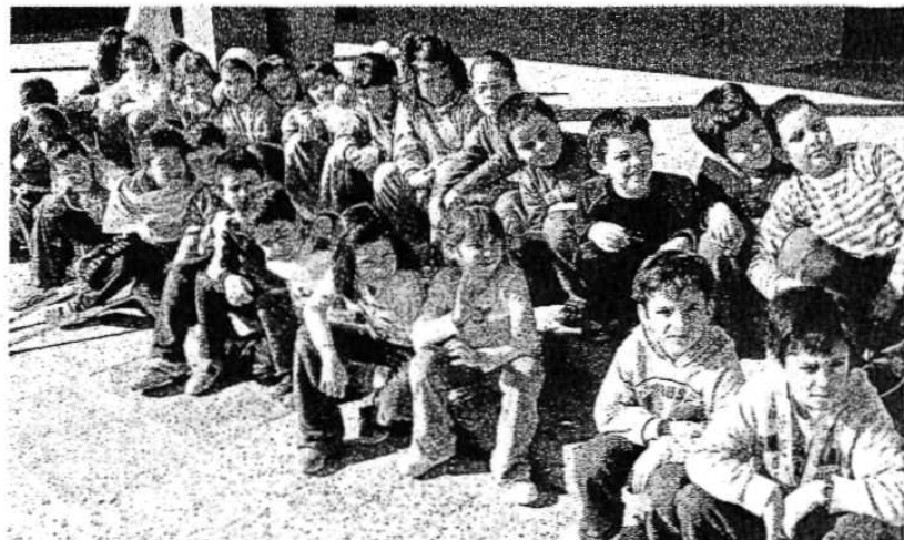
Los pequeños atendieron a las explicaciones sobre el reciclaje en el patio aprovechando el buen tiempo.

Entre los actos previstos para este mes destacan el cuentacuentos con mayores y un análisis del municipio desde la perspectiva de género.