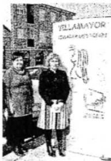
Coordinadora y alcaldesa./ENE

Asimismo, dentro del compromiso municipal con este proyecto, se ha elaborado un nuevo programa reforzando las actividades del club, se ce-