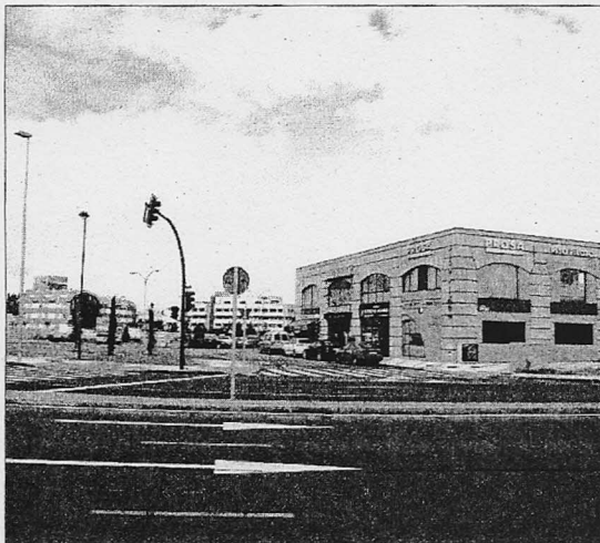
Los empresarios se quejan de los malos accesos al centro comercial

La otra posibilidad que proponen es instalar en sus terrenos una parada del autobús que les proporcionaría una entrada directa. Existe un informe policial en el que se asegura que