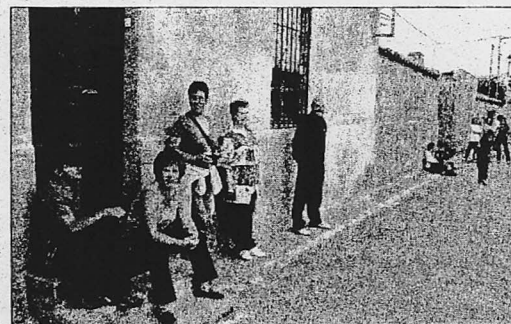
El buen tiempo anima al público a disfrutar de estas fiestas

Por lo que se refiere a la jornada de hoy, se presenta llena de actividades, entre ellas una exposición de vehículos clásicos, el I campeonato de enduro de Castilla y León, un encuentro de motos custom y chopper , y una chorizada o una exhibición acrobática.