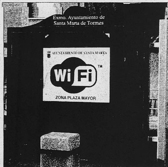
La Plaza Mayor de Santa Marta es zona wifi / TRIBUNA

A su juicio, Santa Marta, es una de las pocas localidades de la provincia que ha realizado una apuesta fuerte y de verdad por la renovación tecnológica como concepto de progreso. Para ello ha presentado al Ministerio de Administraciones Públicas un am-