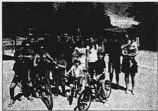
Las fiestas de Valdelagua son un prelude de las de Santa Marta / BENITO