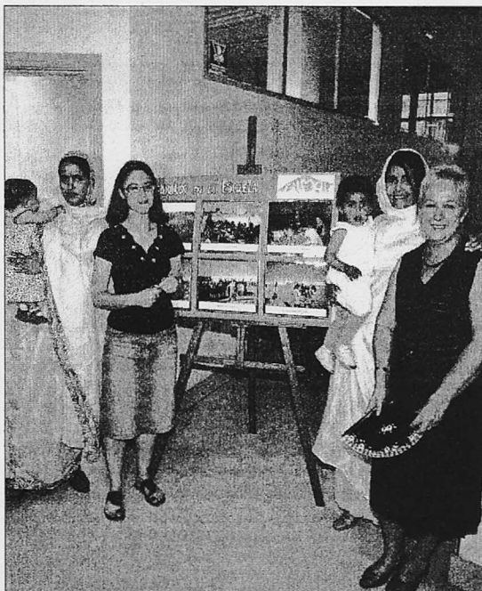
Un momento de la presentación de Rimal

El origen de este movimiento solidario está en 2006, en cuyo verano