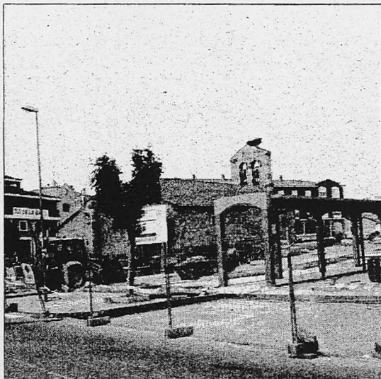
Obras del Plan E en los alrededores de la Plaza Mayor de Carbajosa

En cuanto al 40 por ciento restante, se destinará a equipamientos. En este sentido, el Ayuntamiento baraja dos ideas importantes, que todavía no se han traducido en palabras. "Pero, al margen de todo esto, lo que queremos es contratar operarios y peones para hacer obras muni-