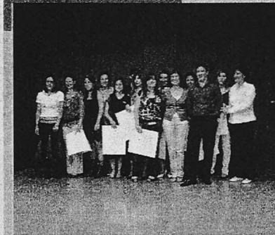
Celebración del fin de curso en el IES Torrente Ballester. El IES Torrente Ballester realizó un acto de despedida del curso a los alumnos de 2º Bachillerato y 2º de Ciclos Formativos de las familias profesionales de Administración y Electricidad y Electrónica. Una emotiva clausura en la que los jóvenes recibieron sus orlas de manos de sus tutores y la insignia del instituto./ENE