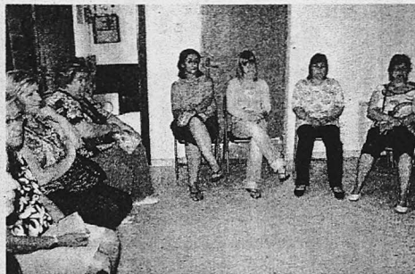
Una docena de vecinos participó ayer en las actividades.