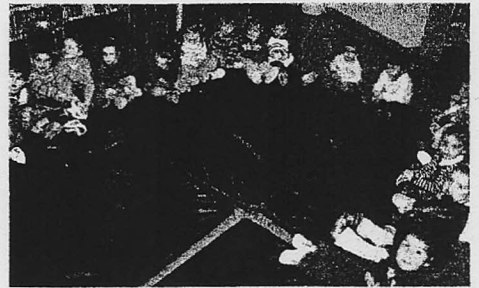
La sala infantil de la biblioteca acogió ayer el cuentacuentos.