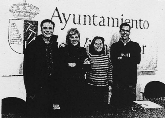
El director de la Escuela, la alcaldesa, la edil de Cultura y un profesor.

Esta homologación supone regularizar la situación de la escuela y reconocer la oficialidad de sus enseñanzas, al tiempo que ofrece la posibilidad de solicitar y obtener ayudas económicas de la Administración regional. Un reconocimiento que viene a reforzar el trabajo y el esfuerzo que realizan, tanto el Consistorio, que aporta 260.000 euros del presupuesto anual, como el equipo directivo y los 24 profesores que desarrollan su labor. Lo que pone de manifiesto el compromiso municipal con este proyecto educativo, que cuenta con 300 alumnos matriculados (el 10% de la población) en las veinte especialidades instrumentales y vocales que se imparten.