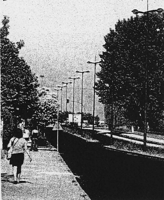
Las salidas de emergencia ya están operativas y las nuevas farolas instaladas./ENE

Un proyecto en el que se ha llevado a cabo una actuación integral, que ha supuesto una inversión de 2,5 millones de euros, de los que 1.950.809 euros proceden de la subvención estatal concedida y otros 600.000 euros aportados por el Consistorio a través de un suplemento de crédito para acometer la renovación de los servicios básicos del municipio.