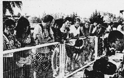
Bautismo de buceo para los más jóvenes. Medio centenar de jóvenes participaron en una de las actividades más novedosas de la programación del "Verano Joven", el bautismo de buceo, que se desarrolló en las piscinas municipales y permitió a los chavales conocer las técnicas del buceo./ENE