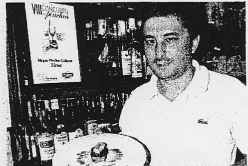
El bar Xirex, premio Pincho Caliente 2009. La "Galleta de morcilla con boletus y micuit" del bar Xirex ha ganado el premio Mejor Pincho Caliente 2009 del VIII Concurso de Pinchos de la Asociación de Hostelería de Salamanca. Un premio a la dedicación y profesionalidad del establecimiento./ENE