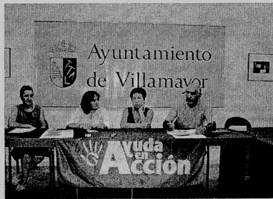
La edil de Cultura y miembros de Ayuda en Acción, presentaron la jornada.

El grupo de voluntariado de la ONG Ayuda en Acción con la colaboración del Ayuntamiento realizará en la tarde de hoy, desde las 16.30 a las 21 horas, en el Aula de Cultura, una serie de juegos no competitivos que concluirán con la representación de una obra de teatro con los que se celebra la XV Semana de la Solidaridad 2009, que se desarrolla bajo el lema "8 objetivos, 8 promesas. Somos la primera generación capaz de erradicar la pobreza". Los niños de 4 a 12 años participarán por grupos en las actividades para conseguir los ocho objetivos del milenio.