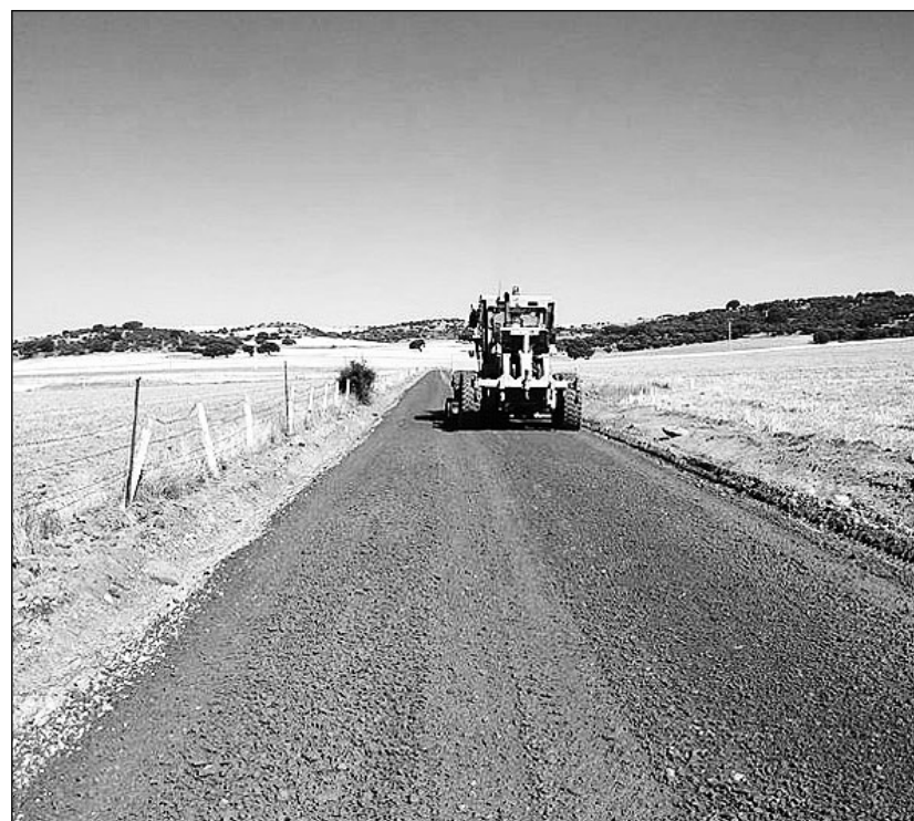
Aspecto actual del camino vecinal entre Sieteiglesias y Buenavista