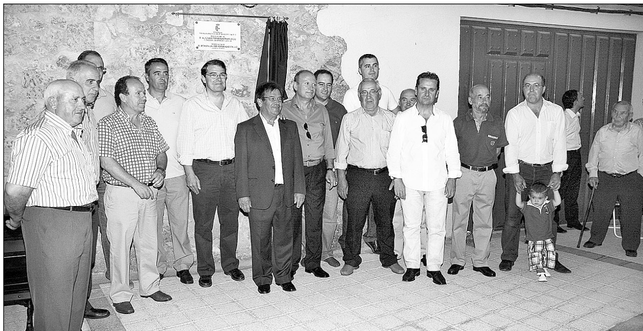
El consejero de Interior y Justicia descubrió una placa en la plaza del Corrillo de Calzada de Valdunciel