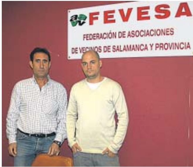
Los presidentes de Astormi y Fevesa, ayer en la sede.