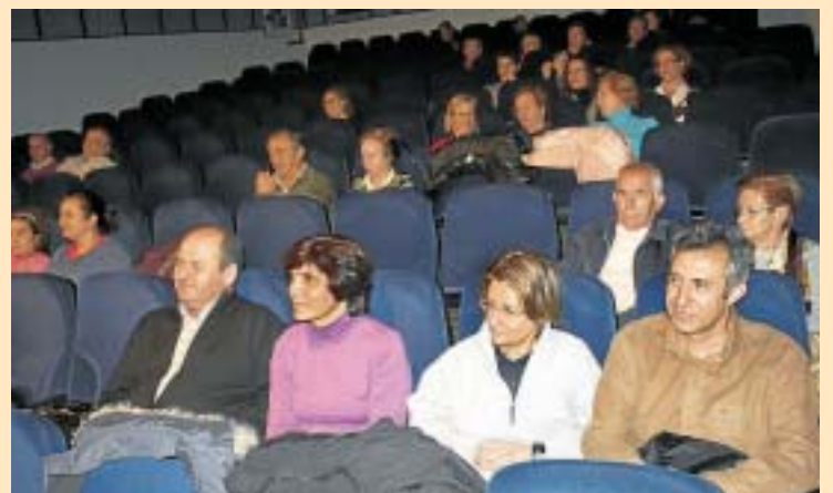
El humor llega al "Otoño Cultural" de Santa Marta. El público reunido en el Auditorio Enrique de Sena disfrutó y se rió con la actuación del programa "Otoño Cultural" organizado por la Concejalía de Cultura, en la que una drag queen protagonizó un monólogo lleno de humor titulado "Lucky&Luke: La vida de Sally"./EÑE