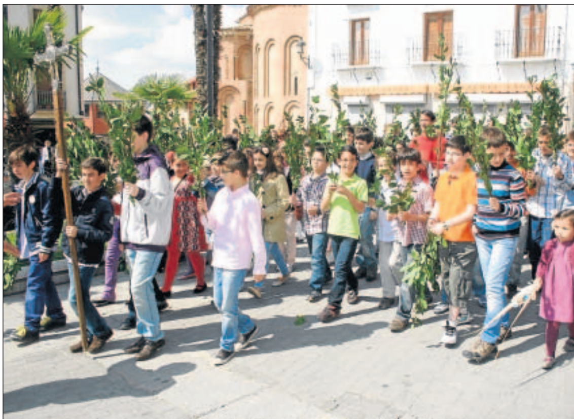
La Semana Santa albense arrancará este domingo con la bendición de los Ramos en la iglesia de San Juan.

Por segundo año consecutivo no se celebrará el tradicional remate de los pasos de Semana Santa, que