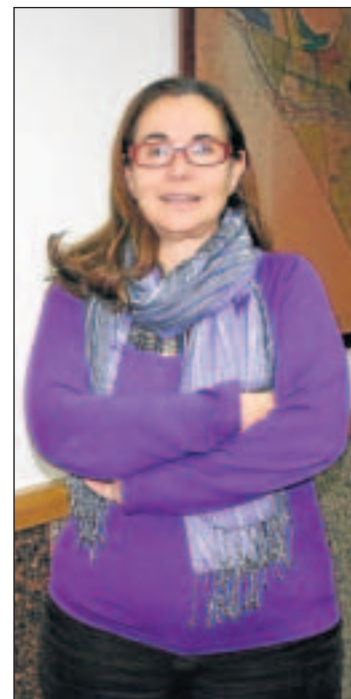
La portavoz del PSOE en la ciudad. MARJÉS

R - Creo que lo que queda más importante por desarrollar es el Plan General. Prácticamente la redacción se llevó a cabo durante la anterior legislatura y ahora se han cambiado algunos aspectos y se han introducido otros. Creo que no se va a poder cerrar este año pero a principios del que viene