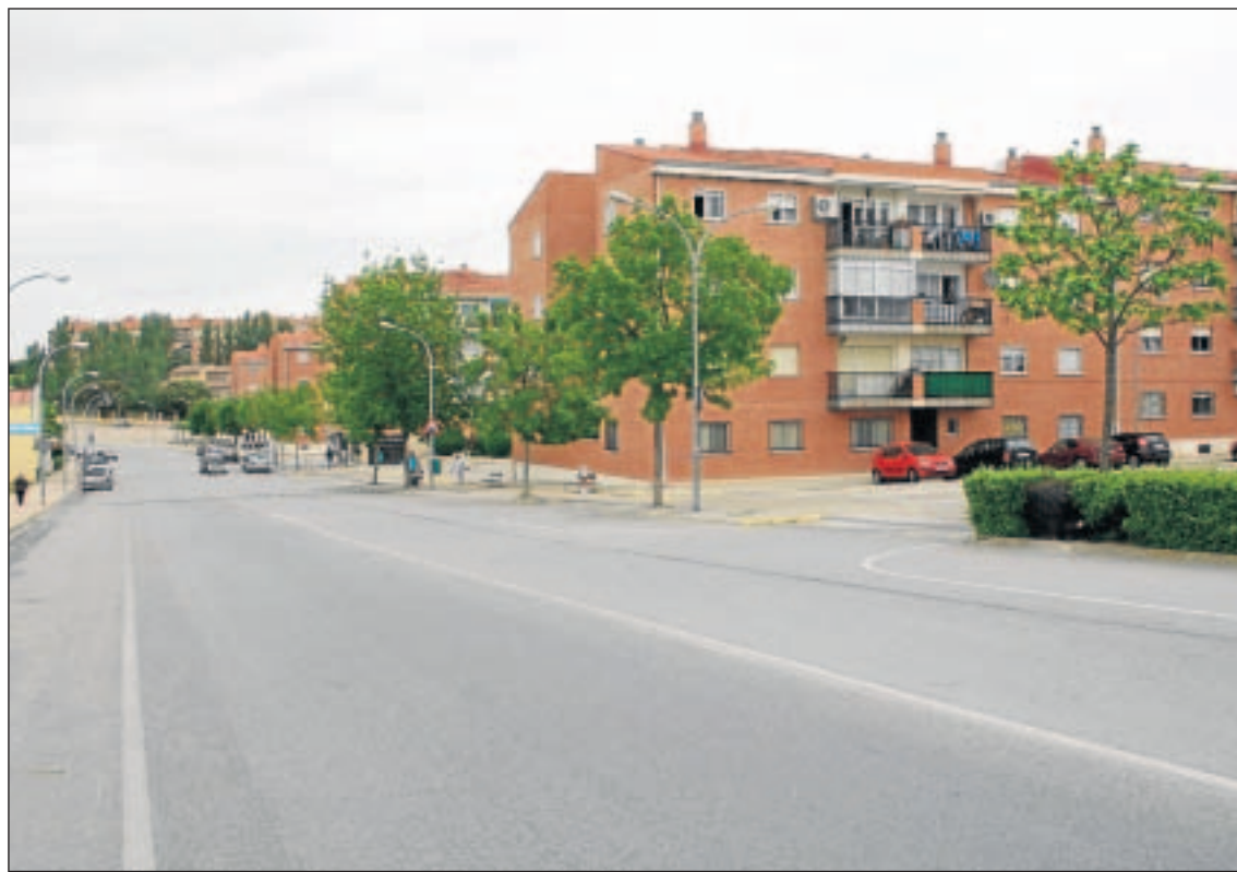
Imagen de la Gran Vía situada en la urbanización El Encinar en el municipio de Terradillos.

Por otro lado, el alcalde reiteró que estarán muy pendientes