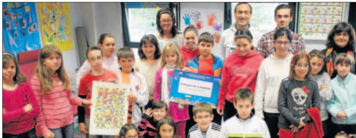
Algunos de los representantes del programa de Ciudad de los Niños de Carbajosa de la Sagrada.