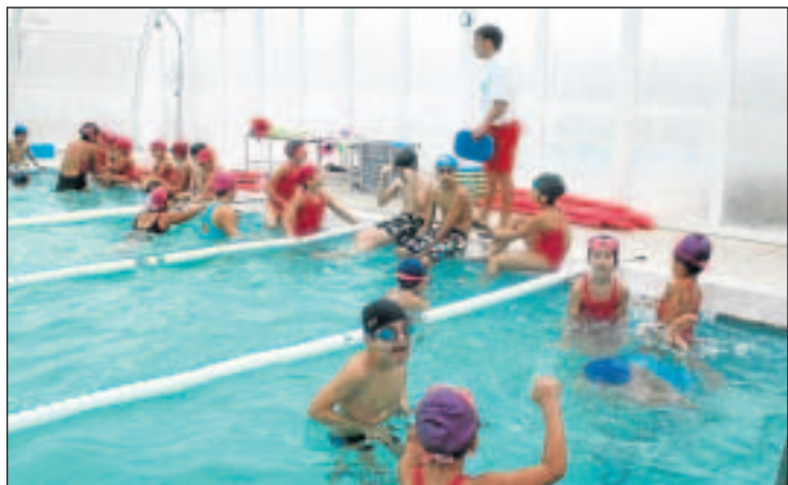
Los cursos para niños de 6 a 14 años son los más demandados.