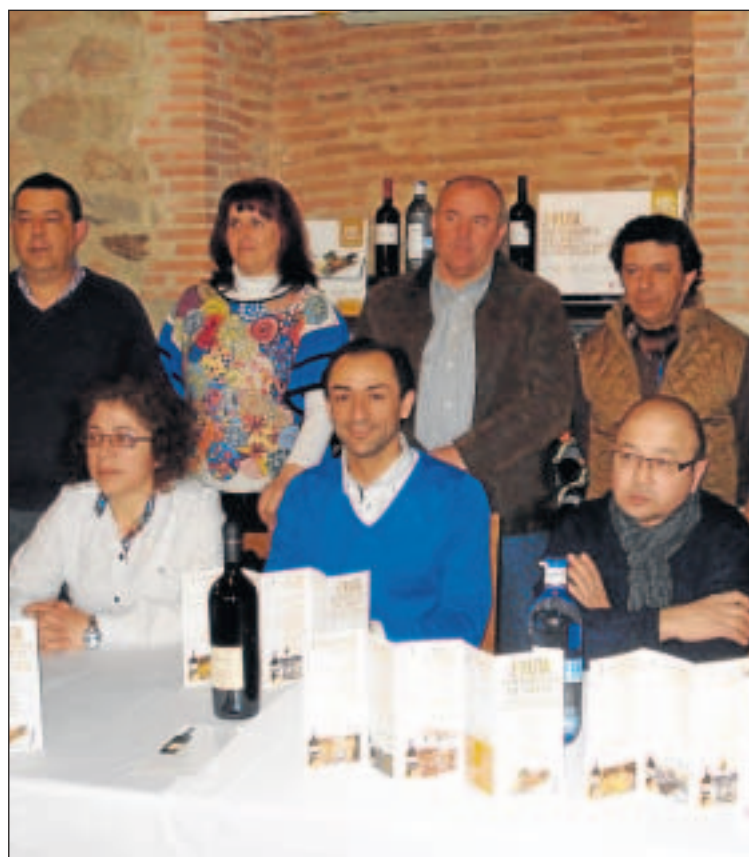
Los organizadores de la II Ruta Gastronómica del Cabrito, durante la presentación.

La II Ruta Gastronómica arranca este fin de semana, 16 y 17, en el restaurante La Beltraneja de Ledesma. A continuación los aficionados al buen yantar continuarán su ruta por la misma localidad, los días 23 y 24, pero en el restaurante Las Ventas. El 2 y 3