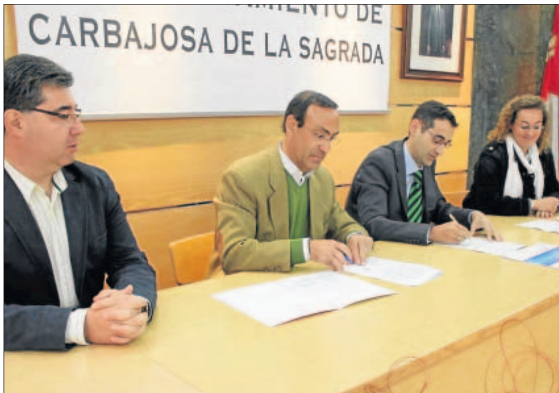
Momento de la firma del acuerdo entre el Ayuntamiento y la Universidad de Salamanca, ayer en Carbajosa de la Sagrada.

Desde el Ayuntamiento estiman que con esta firma se beneficiarán un millar de pequeños. La forma para acceder a este servicio es a través del número de teléfono del Ayuntamiento. Los interesados ya pueden apuntarse, puesto que la Usal comenzará las prácticas a partir del próximo mes de noviembre, concretamente el