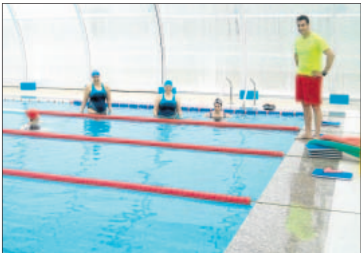
Las clases en la piscina climatizada comienzan el próximo día 21.