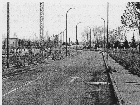
La zona del Camino del Canto ha renovado su pavimentación y alumbrado./ENE