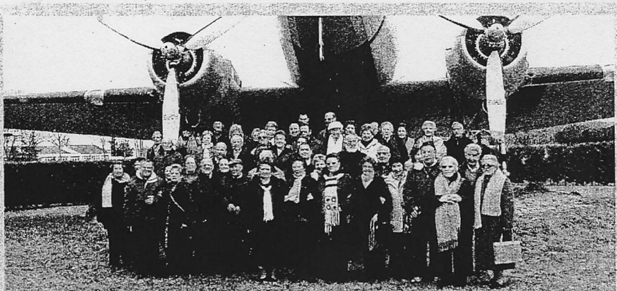
La Asociación de Mayores San Juan visita Matacán. 50 mayores de la Asociación San Juan visitaron la Base Aérea de Matacán, donde conocieron los aviones militares y diferentes instalaciones, como hangares y talleres./ENE