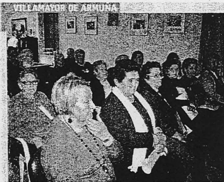
Charla para prevenir la depresión Los mayores de Villamayor participaron ayer en una nueva sesión del "Mes de la Salud", en la que se analizó la "Prevención y pautas para combatir la depresión". Charla que ayudó a los mayores a buscar motivaciones para no deprimirse./ENE

La Concejalía de Igualdad de Villamayor celebrará esta tarde el tercer taller de igualdad organizado con la colaboración de la Asociación de Mujeres, Asmuvi. Una sesión que comenzará a partir de las 20 horas y se centrará en el desmontaje de ciertos mitos o aseveraciones que se dan por ciertas, que denigran y perjudican a la mujer./ENE