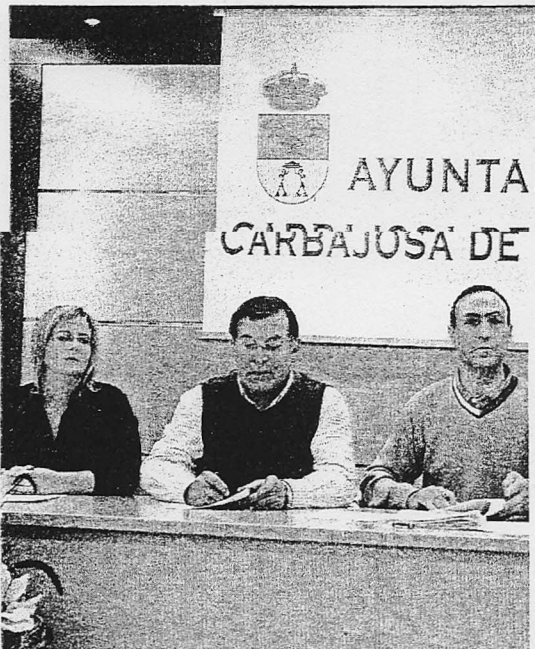
El equipo de Gobierno se reunió para analizar la distribución de partidas.

En estos momentos, el grueso de las inversiones y el nivel del gasto no están totalmente definidos y se determinarán cuando se cierre el que será el presupuesto definitivo para este año.