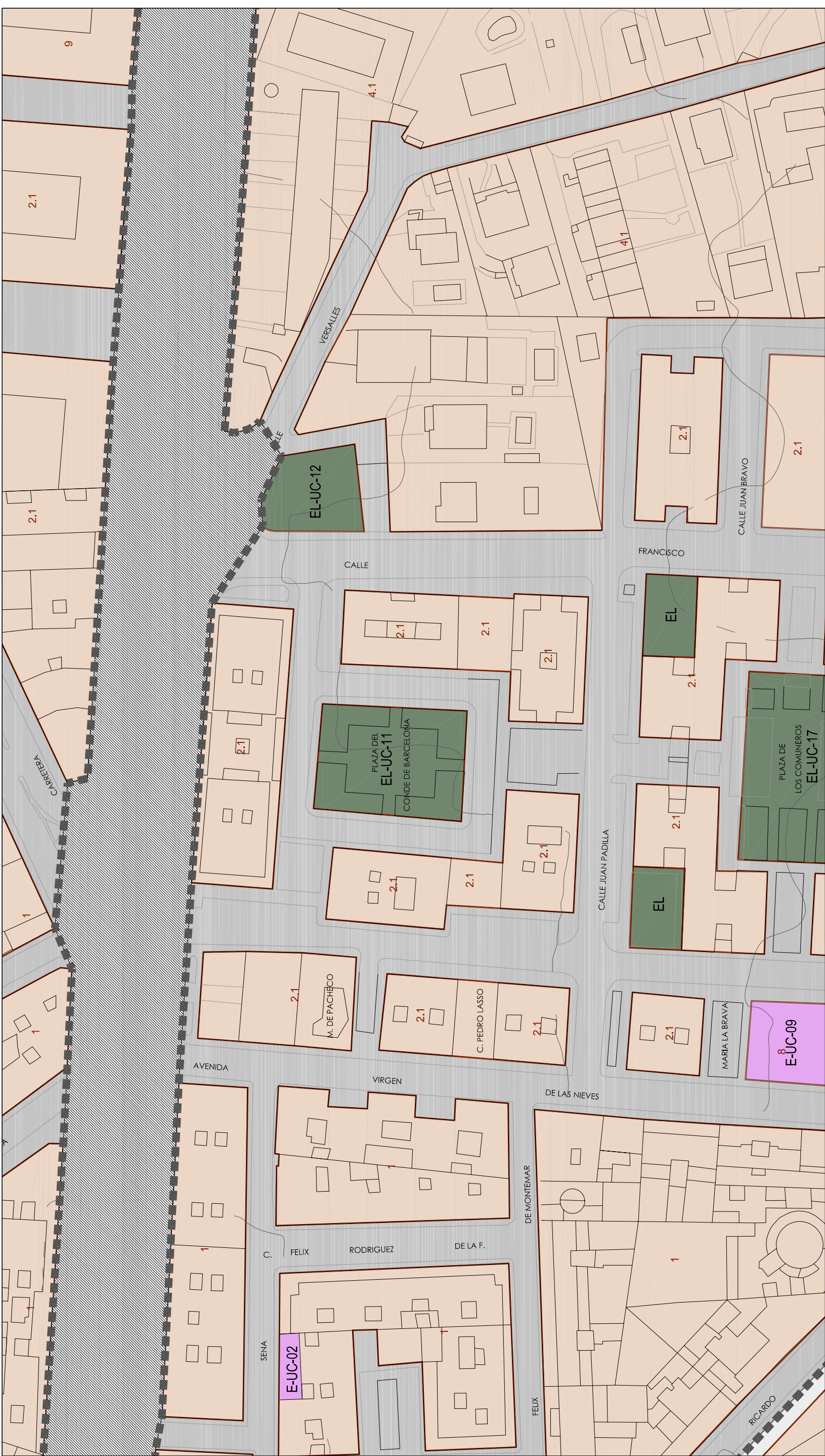
Localización en término municipal