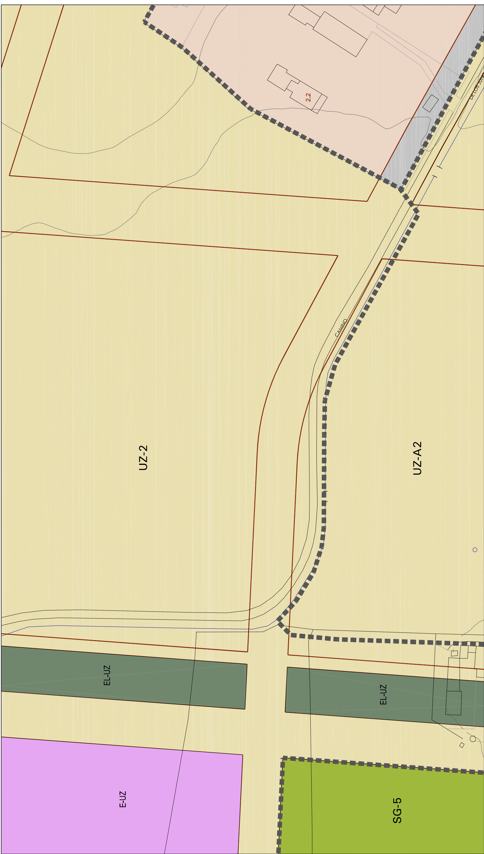
Localización en término municipal